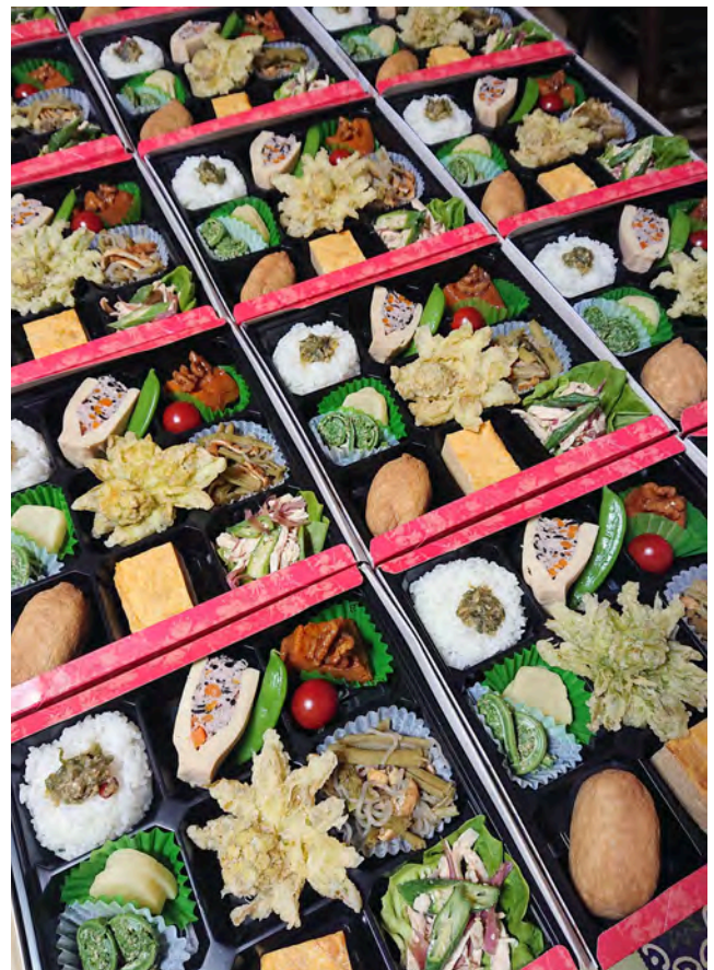
※写真はイメージです。当日作る料理とは異なります。